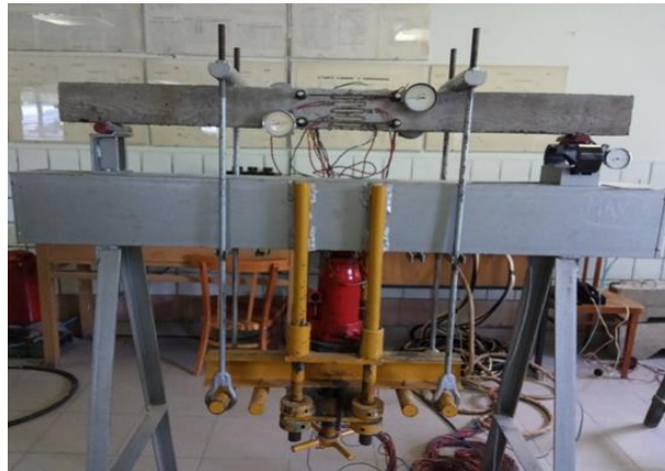
Рис. 3. Стенд для випробування дослідних балок.