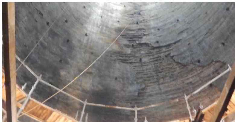
Рис. 2. Вид на деякі доступні ділянки внутрішньої поверхні стовбура башти Fig. 2. View of some accessible areas of the inner surface of the tower trunk

Результати інструментальних вимірювань фактичних кроків арматури із статистичною обробкою за нормальним законом розподілу, наведені у табл. 2.